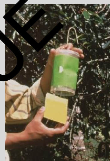
Figure 12. Piège sec à fond ouvert (Phase IV).