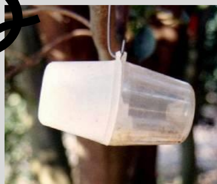
Figure 17. Variante du piège Steiner.