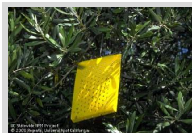
Figure 2. Piège ChamP.