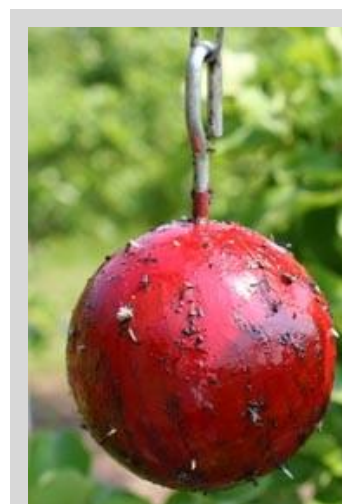
Figure 13. Piège sphérique rouge.

De nombreux types d'insectes seront piégés par ce dispositif. Il sera nécessaire de bien distinguer la mouche des fruits visée des autres insectes non visés qui pourraient se trouver sur ces pièges.