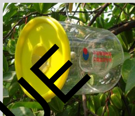
Figure 16. Variante du piège Steiner.