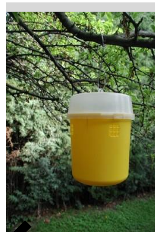
Figure 18. Piège Tephri.

Le piège Tephri est semblable au piège McP. Il s'agit d'un cylindre vertical, d'une hauteur de 15 cm et d'un diamètre de 12 cm à la base, qui peut contenir jusqu'à 450 ml de liquide (Figure 18). Il est constitué d'une base jaune et d'un couvercle transparent qui peuvent être séparés pour faciliter l'entretien. Des ouvertures sont situées le long du pourtour supérieur de la base jaune, et il existe un orifice invaginé au niveau du fond. À l'intérieur du couvercle se trouve une nacelle où sont placés les attractifs. Un crochet en fil de fer, situé en haut du corps du piège, est utilisé pour suspendre le piège aux branches d'arbres.