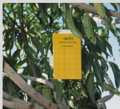
Figure 19. Piège à panneau jaune.

Le piège à panneau jaune (YP) est constitué d'un panneau en carton jaune, rectangulaire (23 cm × 14 cm), recouvert de plastique (Figure 19). Le rectangle est enrobé des deux côtés d'une mince couche de matériau englué. Le piège Rebell est un piège de type YP tridimensionnel, constitué de deux panneaux rectangulaires jaunes (15 cm × 20 cm) en plastique (polypropylène) qui s'entrecroisent, ce qui les rend très solides (Figure 20). Le piège est aussi enrobé d'une mince couche de matériau englué des deux côtés de chacun des panneaux. Un crochet en fil de fer, placé en haut du corps du piège, est utilisé pour suspendre le piège aux branches des arbres.