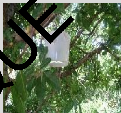
Figure 7. Piège Maghreb-Med ou Piège marocain.

attractifs à base de paraféromones spécifiques des mâles, le CUE, le Capilure (CE), le TML et le ME.