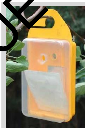
Figure 3. Piège « Easy trap ».