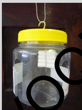
Figure 6. Piège Lynfield.

Le piège utilise un système d'attractifs et d'insecticides pour attirer et tuer les mouches des fruits visées. Le couvercle vissé est généralement codé par sa couleur en fonction du type d'attractif qui est utilisé (rouge, CE/TML; blanc, ME; jaune, CUE). Pour tenir l'attractif, un crochet domestique à pointe torsadée de 2,5 cm (ouverture maintenue fermée) vissé par le haut au travers du couvercle est utilisé. Le piège utilise les