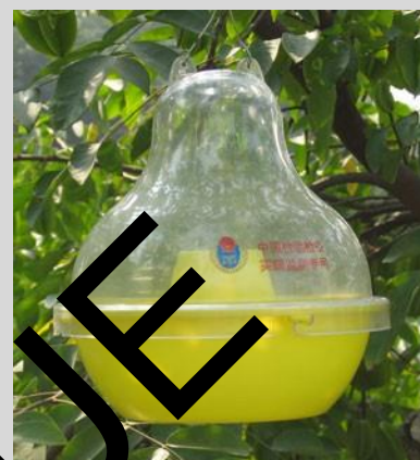
Figure 9. Piège McPhail en plastique.

Pour appâter avec des pastilles de levure, mélanger trois à cinq pastilles de torula dans 500 ml d'eau ou suivre les recommandations du fabricant. Agiter pour dissoudre les pastilles. Pour appâter avec un hydrolysate de protéines, mélanger l'hydrolysate et le borax (s'il n'a pas déjà été ajouté aux protéines) dans de l'eau jusqu'à obtention d'une concentration de 5 à 9 pour cent de protéines hydrolysées et de 3 pour cent de borax.