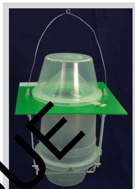
Figure 10. Piège entonnoir modifié.

Lorsque le piège MLT est utilisé comme piège sec, un insecticide approprié (non répulsif à la concentration utilisée), tel que le dichlorvos ou une bandelette de deltaméthrine (DM), est placé à