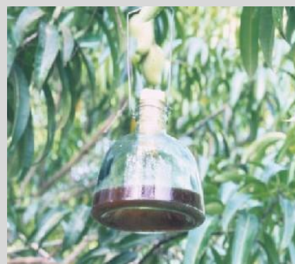
Figure 8. Piège McPhail.

Le piège McPhail (McP) classique est un récipient invaginé en forme de poire, en verre ou plastique transparent. Le piège a une hauteur de 17,2 cm, une largeur de 16,5 cm à la base et il peut contenir jusqu'à 500 ml de solution (Figure 8). Les éléments du piège comprennent un bouchon en caoutchouc ou un couvercle en plastique qui ferme hermétiquement la partie supérieure du piège et un crochet en fil de fer pour suspendre les pièges aux branches des