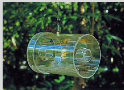
Figure 15. Piège Steiner classique.