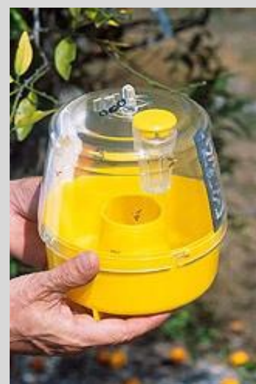
Figure 11. Piège multileurre « Multilure ».