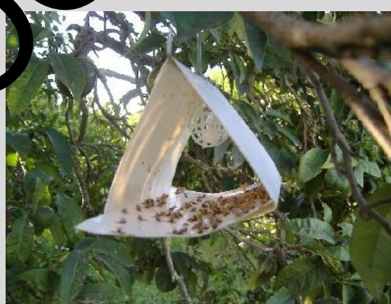
Figure 5. Piège Jackson ou piège Delta.

Le piège Jackson est creux, en forme de delta et fabriqué en carton ciré blanc. Il a une hauteur de 8 cm, une longueur de 12,5 cm et une largeur de 9 cm (Figure 5). Les autres éléments du piège sont les suivants: une plaquette amovible rectangulaire blanche ou jaune en carton ciré qui est recouverte d'une fine couche d'adhésif et qui sert à piéger les mouches des fruits lorsqu'elles se posent à l'intérieur du corps du piège; un bouchon en polymère ou une mèche en coton à l'intérieur d'un panier en plastique ou d'une corbeille en fer; et un crochet en fil de fer situé en haut du corps du piège.