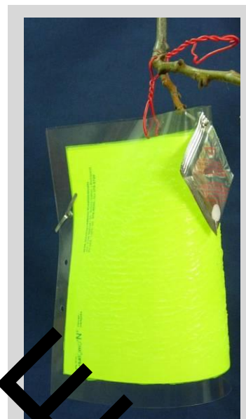
Figure 4. Piège gluant « en cape » jaune fluorescent.