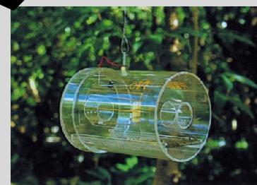
Figura 15. Trampa Steiner convencional.