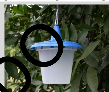
Figura 14. Trampa Sensus.