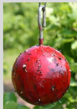
Figura 13. Trampa de esfera roja.

La trampa de esfera roja o verde puede utilizarse sin cebo, pero es más eficiente para la captura de moscas de la fruta cuando se usa con cebo. Esta trampa atrae a las moscas de la fruta sexualmente maduras y listas para ovipositar.