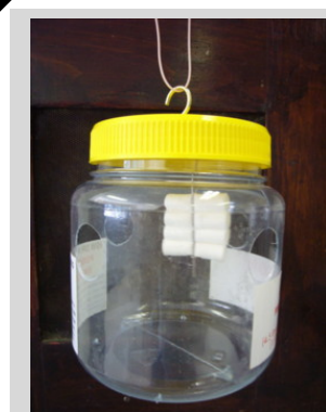
Figura 6. Trampa Lynfield.