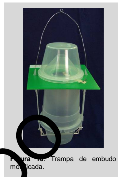
Figura 10. Trampa de embudo modificada.

Debido a que es un diseño de trampa no pegajosa, tiene virtualmente capacidad ilimitada de capturar y una vida extensa en el campo. El cebo se coloca en el techo, de tal forma que el dispensador del cebo se coloca al medio del agujero grande en el techo. Un pedazo pequeño de matriz impregnado con un agente letal se coloca tanto dentro del recipiente superior e inferior para capturar con el fin de matar a las moscas de la fruta que entren.