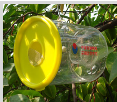
Figura 16. Trampa Steiner.