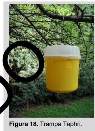
Figura 18. Trampa Tephri.

Esta trampa se ceba con proteína hidrolizada a una concentración del 9%; sin embargo, también puede emplearse con otros atrayentes de proteína líquida, como los descritos para la trampa McPhail convencional de vidrio o con el atrayente alimenticio sintético seco para hembras y con TML en una cápsula o en forma líquida como se describió para las trampas JT/Delta y de panel amarillo. Si la trampa se usa con atrayentes de proteína líquida o con atrayentes sintéticos secos combinados con un sistema de retención de líquido y sin los agujeros laterales, no será necesario el uso de insecticida. Sin embargo, cuando se usa como trampa seca con los agujeros laterales, es necesario utilizar un algodón impregnado con una solución de insecticida (por ejemplo, malation) u otro agente letal para evitar el escape de los insectos capturados. Otros insecticidas adecuados son tiras de cipermetrina o deltametrina (DM) colocadas dentro de la trampa para matar a las moscas de la fruta. El DM se aplica en una tira de polietileno que se coloca sobre la plataforma plástica dentro de la parte superior de la trampa. Alternativamente, se podrá utilizar DM en un círculo de malla mosquitera impregnada y su efecto letal durará por lo menos seis meses en condiciones de campo. La malla se debe fijar al techo interno de la trampa con algún material adhesivo.