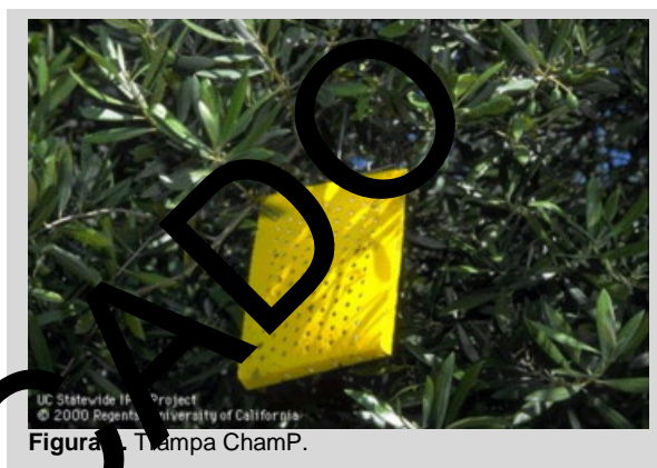
Figura 2. Trampa ChamP.

La trampa ChamP es una trampa hueca de tipo panel amarillo con dos paneles laterales perforados y pegajosos. Cuando se doblan ambos paneles, la trampa adquiere una forma rectangular (18 cm × 15 cm), y se crea una cámara central para colocar el atrayente (Figura 2). Un gancho de alambre ubicado en la parte superior de la trampa se utiliza para colocarla en las ramas.