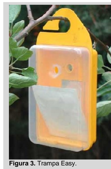
Figura 3. Trampa Easy.

La trampa es para múltiples objetivos. Puede utilizarse seca con cebo de paraferomonas (por ejemplo, TML, CUE, ME) o atrayentes sintéticos alimenticios (por ejemplo, atrayente 3C y ambas combinaciones del atrayente 2C) y con un sistema de retención tal como dichlorvos. También puede utilizarse con cebo húmedo con atrayentes de proteínas líquidas y pueden contener hasta 400 ml de mezcla. Cuando se utilizan atrayentes sintéticos alimenticios, uno de los dispensadores (el que contiene putrescina) se coloca dentro de la parte amarilla de la trampa y los demás dispensadores se dejan vacíos.