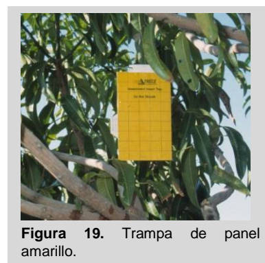
Figura 19. Trampa de panel amarillo.

La trampa de panel amarillo (YP) consiste en una lámina rectangular de color amarillo (23 cm x 14 cm) recubierta de plástico (Figura 19). El rectángulo está cubierto por ambos lados con una capa delgada de material pegajoso. La trampa Rebell es una trampa tridimensional de tipo YP con dos láminas rectangulares de color amarillo cruzadas (15 cm x 20 cm) elaboradas de plástico (polipropileno), por lo cual es extremadamente durable (Figura 20). La trampa también está cubierta con una capa delgada de material pegajoso en ambos lados de ambas láminas. Un gancho de alambre, colocado en la parte superior del cuerpo de la trampa, se utiliza para colgarla de las ramas de los árboles.