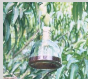
Figura 8. Trampa McPhail.

La trampa McPhail (McP) convencional es un contenedor invaginado en forma de pera, de vidrio o plástico transparente. La trampa mide 17,2 cm de alto y 16,5 cm de ancho en la base y puede contener hasta 500 ml de solución (Figura 8). La trampa consta, además, de un tapón de corcho o tapa de plástico que sella la parte superior de la trampa y de un gancho de alambre para colgar la trampa de las ramas de los árboles. La versión plástica de la trampa McPhail mide 18 cm de alto y 16 cm de ancho en su base y puede contener hasta 500 ml de solución (Figura 9). La parte superior es transparente y la base es amarilla.