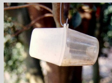
Figura 17. Trampa Steiner.