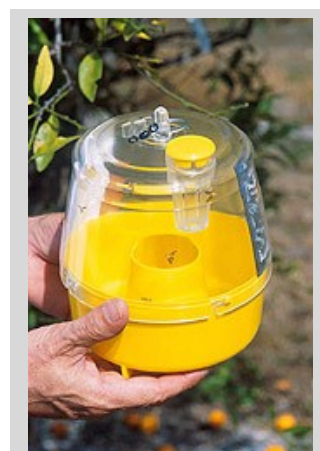
Figura 11. Trampa Multilure.

Cuando la MLT se utiliza como trampa húmeda, se debería añadir un surfactante al agua. En climas cálidos, puede utilizarse 10% de propileno glicol para disminuir la evaporación del agua y la descomposición de las moscas de la fruta capturadas.