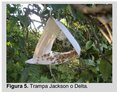
Figura 5. Trampa Jackson o Delta.

La trampa Jackson es una trampa en forma de delta, fabricada de cartón encerado color blanco. Mide 8 cm de alto, 12,5 cm de largo y 9 cm de ancho (Figura 5). Las partes adicionales incluyen un inserto rectangular color blanco o amarillo de cartón encerado cubierto por una capa delgada de adhesivo que se utiliza para capturar moscas de la fruta cuando éstas se posan dentro del cuerpo de la trampa; una cápsula de polímero o mecha de algodón dentro de una canasta plástica o contenedor de alambre; y un gancho de alambre colocado en la parte superior del cuerpo de la trampa.