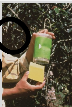
Figura 12. Trampa seca de fondo abierto (Fase IV).

Ésta es una trampa de fondo abierto, cilíndrica, seca, que puede estar hecha de plástico opaco de color verde o de cartón encerado color verde. El cilindro mide 15,2 cm de alto y 9 cm de diámetro en su parte superior y 10 cm de diámetro en su parte inferior (Figura 12). Su parte superior es transparente y tiene tres agujeros (cada uno de 2,5 cm de diámetro) espaciados uniformemente alrededor de la circunferencia del cilindro, a medio camino entre los dos extremos, y un fondo abierto, y se utiliza con un inserto pegajoso. Un gancho de alambre, colocado en la parte superior del cuerpo de la trampa, se utiliza para colgarla de las ramas de los árboles.