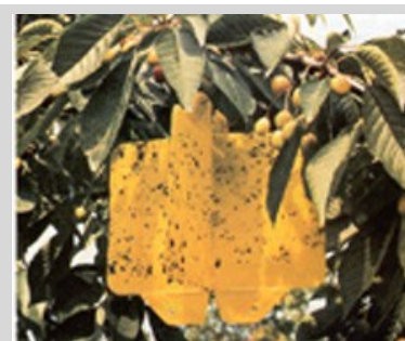
Figura 20. Trampa Rebell.

Estas trampas pueden utilizarse como trampas visuales por sí solas y cebadas con TML, spiroketal o sales de amonio (acetato de amonio). Los atrayentes podrán colocarse en dispensadores de liberación controlada, tal como una cápsula polimérica. Los atrayentes se colocan en la parte de enfrente de la trampa. Los atrayentes también pueden mezclarse con el recubrimiento del cartón. Su diseño bidimensional y la mayor superficie de contacto hacen que estas trampas sean más eficaces, en términos de capturas de moscas, que las trampas de tipo JT y McPhail. Es importante considerar que estas trampas requieren procedimientos especiales de transporte, entrega, y métodos especiales de preselección de moscas de la fruta porque son tan pegajosas que los especímenes pueden destruirse durante la manipulación. Aunque estas trampas pueden utilizarse en la mayoría de tipos de aplicaciones de los programas de control, se recomienda su uso para las fases de poserradicación y para áreas libres de moscas, donde se requieren trampas de gran sensibilidad. Estas trampas no deberían emplearse en áreas sujetas a liberación masiva de moscas de la fruta estériles, debido a que capturarían un gran número de moscas de la fruta liberadas. Es importante señalar que, debido al color amarillo y al diseño abierto de estas trampas, éstas tienden a capturar también otros insectos no objetivo, incluyendo enemigos naturales de mosca de la fruta y polinizadores.