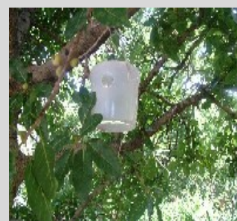
Figure 7. Trampa Maghreb-Med o Marruecos.