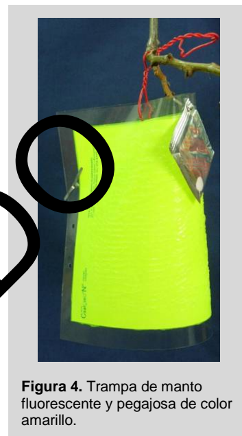
Figura 4. Trampa de manto fluorescente y pegajosa de color amarillo.

La trampa utiliza la combinación óptima de atrayentes visuales (amarillo fluorescente) y químicos (cebo sintético para mosca de la fruta de la cereza). La trampa se mantiene fija con un pedazo de alambre, sujetado a la rama o poste. El dispensador del cebo se sujeta al borde superior en la parte del frente de la trampa, con el cebo colgado en frente de la superficie pegajosa. La superficie pegajosa de la trampa tiene una capacidad de captura de aproximadamente 500 a 600 moscas de la fruta. Los insectos atraídos por la acción combinada de estos dos estímulos se atrapan en la superficie pegajosa.