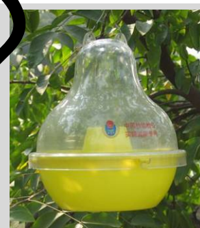
Figura 9. Trampa McPhail plástica.

Para colocar tabletas de levadura como cebo, mezcle tres y cinco tabletas de torula en 500 ml de agua o siga las indicaciones del fabricante. Revuelva para disolver las tabletas. Para utilizar proteína hidrolizada como cebo, mezcle la proteína hidrolizada y el bórax (si no se ha añadido ya a la proteína) en agua hasta llegar a una concentración de 5 a 9% de proteína hidrolizada y 0,2% de bórax.