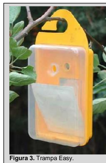
Figura 3. Trampa Easy.

La trampa es para múltiples objetivos. Puede utilizarse seca con cebo de paraferomonas (por ejemplo, TML, CUE, ME) o atrayentes sintéticos alimenticios (por ejemplo, atrayente 3C y ambas combinaciones del atrayente 2C) y con un sistema de retención como dichlorvos. También puede utilizarse con cebo húmedo con atrayentes de proteínas líquidas y pueden contener hasta 400 ml de mezcla. Cuando se utilizan atrayentes sintéticos alimenticios, uno de