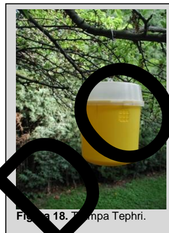
Figura 18. Trampa Tephri.

La Trampa Tephri es similar a la trampa McP. Consiste en un cilindro vertical de 15 cm de alto y una base de 12 cm de diámetro y tiene capacidad para hasta 450 ml de líquido (Figura 18). Su base es amarilla y su tapa es transparente, que pueden separarse para facilitar el servicio. Tiene agujeros de entrada alrededor de la periferia de la parte superior de la base amarilla, y una abertura invaginada en el fondo. Dentro de la tapa se halla una plataforma sobre la cual se colocan los atrayentes. Un gancho de alambre, colocado sobre el cuerpo de la trampa, se utiliza para colgarla de las ramas de los árboles.