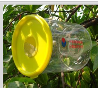
Figura 16. Trampa Steiner.

La trampa Steiner es un cilindro horizontal transparente con dos aberturas en cada extremo. La trampa Steiner convencional mide 14.5 cm de largo y 11 cm de diámetro (Figura 15). Hay una serie de versiones de las trampas Steiner. Entre ellas incluyen la trampa Steiner que mide 12 cm de largo y 10 cm de diámetro (Figura 16) y 14 cm de largo y 8.5 cm de diámetro (Figura 17). Un gancho de alambre, colocado en la parte superior del cuerpo de la trampa, se utiliza para colgarla de las ramas de los árboles.