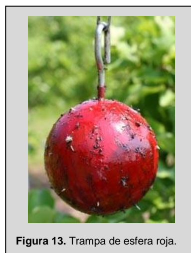
Figura 13. Trampa de esfera roja.

Esta trampa es una esfera de color rojo de 8 cm de diámetro (Figura 13). La trampa imita el tamaño y la forma de una manzana madura. También se utiliza una versión verde de esta trampa. La trampa está cubierta con un material pegajoso y está cebada con el olor sintético de fruta butil hexanoato, que posee una fragancia similar a la de una fruta madura. En la parte superior de la esfera está colocado un gancho de alambre que sirve para colgarla de las ramas de los árboles.