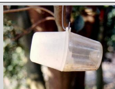
Figura 17. Trampa Steiner.

Esta trampa utiliza los atrayentes de paraferomonas específicos para machos TML, ME y CUE. El atrayente se suspende en el centro interior de la trampa. El atrayente podrá ser una mecha de algodón impregnado en 2 a 3 ml de una mezcla de paraferomonas o un dispensador con el atrayente y un insecticida (usualmente malation, dibrom o deltametrina) como agente que mata.