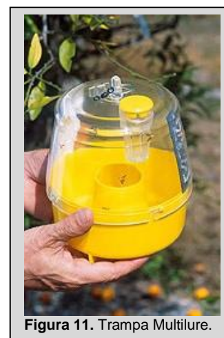
Figura 11. Trampa Multilure.

Cuando la MLT se utiliza como trampa húmeda, se debería añadir un surfactante al agua. En climas cálidos, puede utilizarse 10% de propileno glicol para disminuir la evaporación del agua y la descomposición de las moscas de la fruta capturadas.