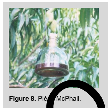
Figure 8. Piè McPhail.

La trampa McPhail (McP) convencional es un contenedor invaginado de forma de pera, de vidrio o plástico transparente. La trampa mide 17.2 cm de alto y 16.5 cm de ancho en la base y puede contener hasta 500 ml de solución (Figura 8). La trampa consta, además, de un tapón de corcho o tapa de plástico que sella la parte superior de la trampa y de un gancho de alambre para colgar la trampa de las ramas de árboles. La versión plástica de la trampa McPhail mide 18 cm de alto y 16 cm de ancho en su base y puede contener hasta 500 ml de solución (Figura 9). La parte superior es transparente y la base es amarilla.