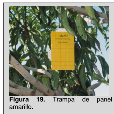
Figura 19. Trampa de panel amarillo.

La trampa de panel amarillo (YP) consiste en una lámina rectangular de color amarillo (23 cm x 14 cm) recubierta de plástico (Figura 19). El rectángulo está cubierto por ambos lados con una capa delgada de material pegajoso. La trampa Rebelle es una trampa tridimensional de tipo panel amarillo con dos láminas rectangulares de color amarillo cruzadas (15 cm x 20 cm) elaboradas de plástico (polipropileno), por lo cual es extremadamente durable (Figura 20). La trampa también está cubierta con una capa delgada de material pegajoso en ambos lados de ambas láminas. Un gancho de alambre, colocado en la parte superior del cuerpo de la trampa, se utiliza para colgarla de las ramas de los árboles.