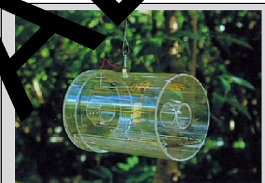
Figura 15. Trampa Steiner convencional.

Ésta es una trampa seca que utiliza paraferomonas específicas para machos o para capturas de hembras, atrayentes alimenticios sintéticos secos. Se coloca un bloque de dichlorvos en el peine de la tapa para matar a las moscas.