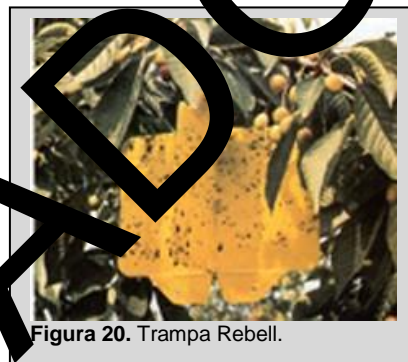
Figura 20. Trampa Rebell.