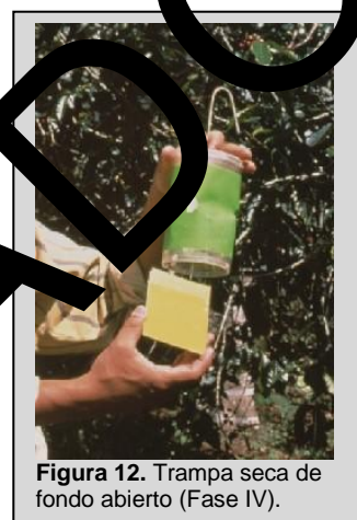
Figura 12. Trampa seca de fondo abierto (Fase IV).

Ésta es una trampa de fondo abierto, cilíndrica, seca, que puede estar hecha de plástico opaco de color verde o de cartón encerado color verde. El cilindro mide 15.2 cm de alto y 9 cm de diámetro en su parte superior y 10 cm de diámetro en su parte inferior (Figura 12). Su parte superior es transparente y tiene tres agujeros (cada uno de 2.5 cm de diámetro) espaciados uniformemente alrededor de la circunferencia del cilindro, a medio camino entre los dos extremos y un fondo abierto, y se utiliza con un inserto pegajoso. Un gancho de alambre, colocado en la parte superior del cuerpo de la trampa, utiliza para colgarla de las ramas de los árboles.