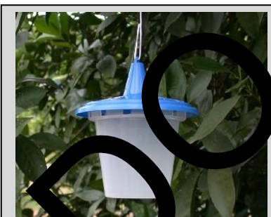
Figura 14. Trampa Sensus.

La trampa Sensus consiste en un cilindro (o cubeta) plástico vertical de 12.5 cm de alto y 11.5 cm de diámetro (Figura 14). Tiene cuerpo transparente y una tapa sobrepuesta color azul con un agujero justo debajo de la misma. Un gancho de alambre colocado sobre la parte superior del cuerpo de la trampa se utiliza para colgarla de las ramas de los árboles.