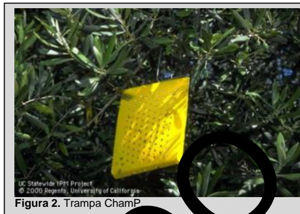
Figura 2. Trampa ChamP.