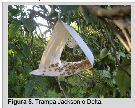
Figura 5. Trampa Jackson o Delta.

La trampa Jackson es hueca y en forma de delta, fabricada de cartón encerado color blanco. Mide 8 cm de alto y 2.5 cm de largo y 9 cm de ancho (Figura 5). Cuenta con partes adicionales, entre ellas un inserto triangular color blanco o amarillo de cartón encerado cubierto por una capa delgada de adhesivo que se utiliza para atrapar moscas de la fruta cuando éstas entran dentro del cuerpo de la trampa; una cápsula de polímero o mecha de algodón dentro de una canasta plástica o contenedor de alambre; y un gancho de alambre colocado en la parte superior del cuerpo de la trampa.