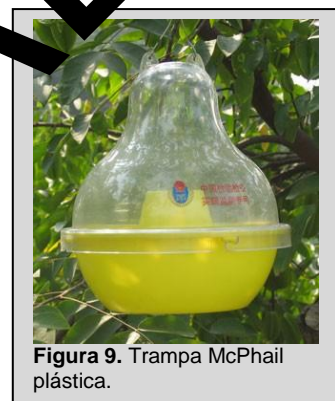
Figura 9. Trampa McPhail plástica.

Esta trampa utiliza un atrayente alimenticio líquido, basado en proteína hidrolizada o tabletas de levadura torula/bórax. Las tabletas de torula son más eficaces que las proteínas hidrolizadas con el tiempo, debido a que su pH se mantiene estable a 9.2. El nivel de pH de la mezcla desempeña un papel muy importante en la atracción de moscas de la fruta. A medida que el pH se vuelve más ácido, menos moscas de la fruta son atraídas a la mezcla.