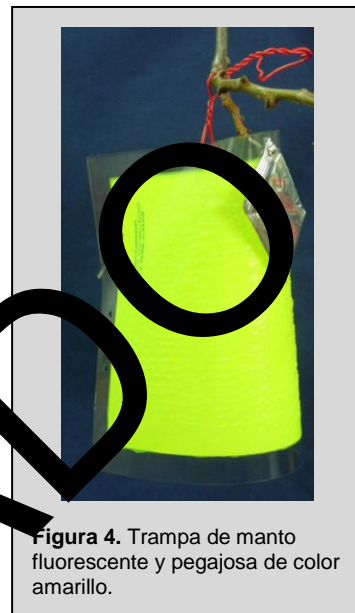
Figura 4. Trampa de manto fluorescente y pegajosa de color amarillo.

La trampa PALz se prepara con hojas plásticas fluorescentes de color amarillo (36 cm × 23 cm). Uno de los lados está cubierto de material pegajoso. Cuando se monta, la hoja pegajosa se coloca alrededor de una rama que se encuentre en posición vertical o en un poste, en forma de “manto” (Figura 4), con el lado pegajoso hacia afuera, y las esquinas traseras se sujetan simultáneamente con clips.