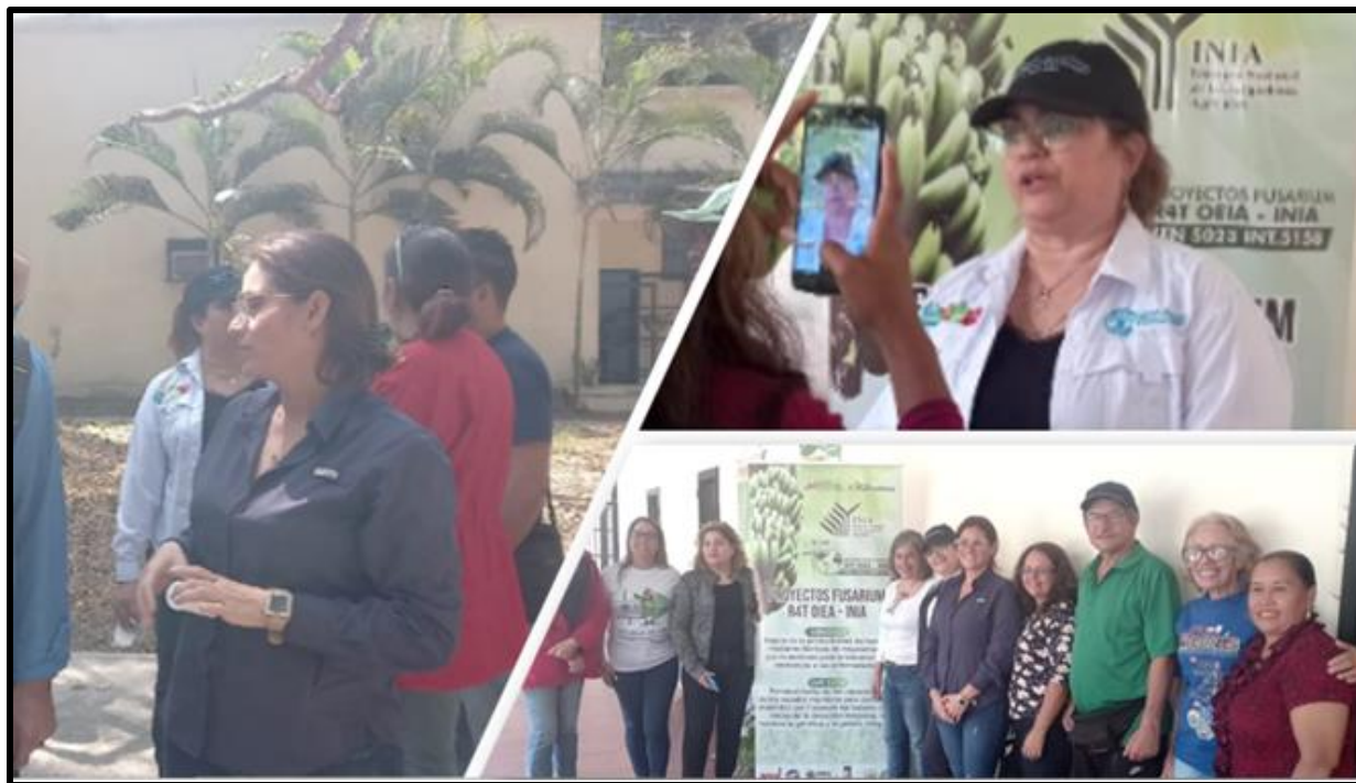
Agricultural Plant Biotechnology Laboratory of the National Agricultural Research Center (CENIAP) of the National Agricultural Research Institute (INIA).