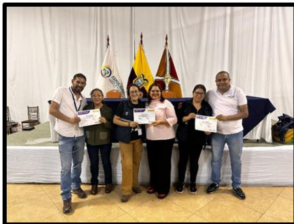
Evaluation Session and Conclusions of the simulations FOC R4T