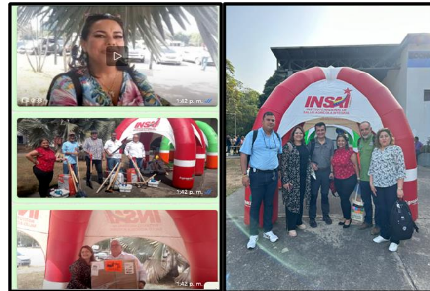
Delivery of inputs and tools to leading producers participating in the compensation pilot