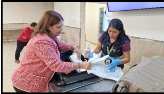
Inspection at Entry Airport. Quito.