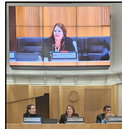
Panel discussion: FAO's role in supporting countries and stakeholders in TR4 prevention, preparedness and response. Fourth Global Conference of the World Banana Forum March 2024