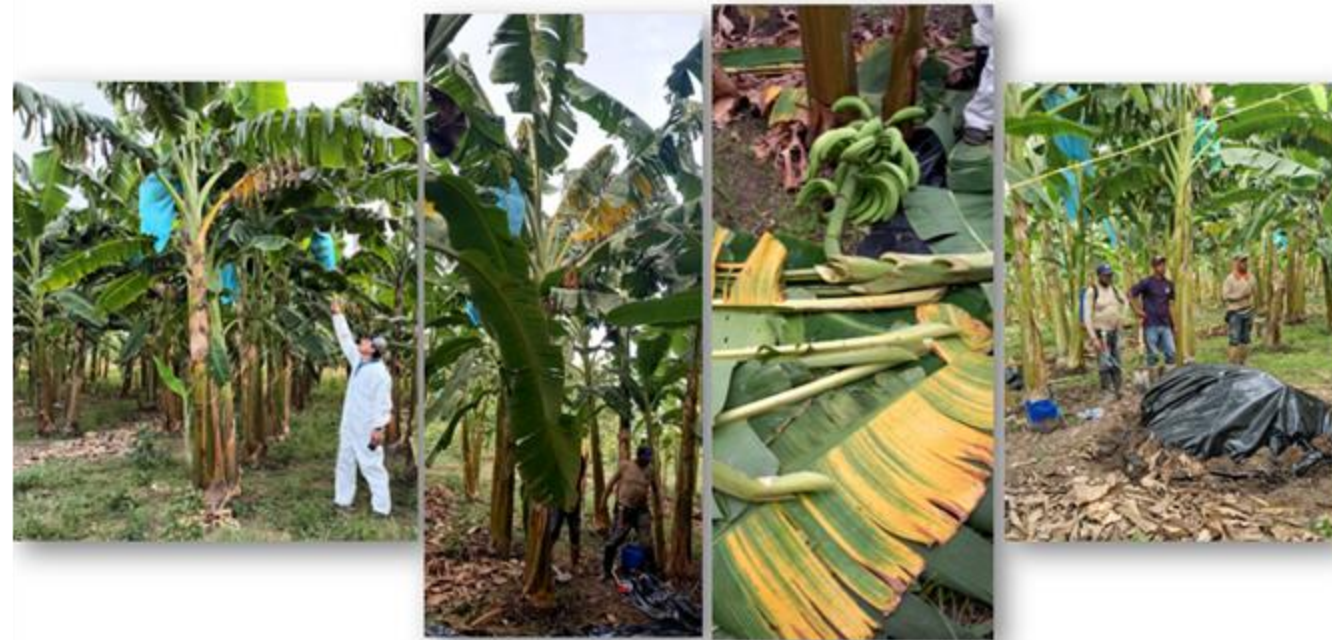
field school in Plátano Hartón with TR4.