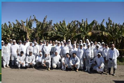
EL SALVADOR. 2018

Organización de las Naciones Unidas para la Alimentación y la Agricultura