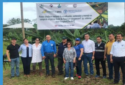
COSTA RICA. 2019