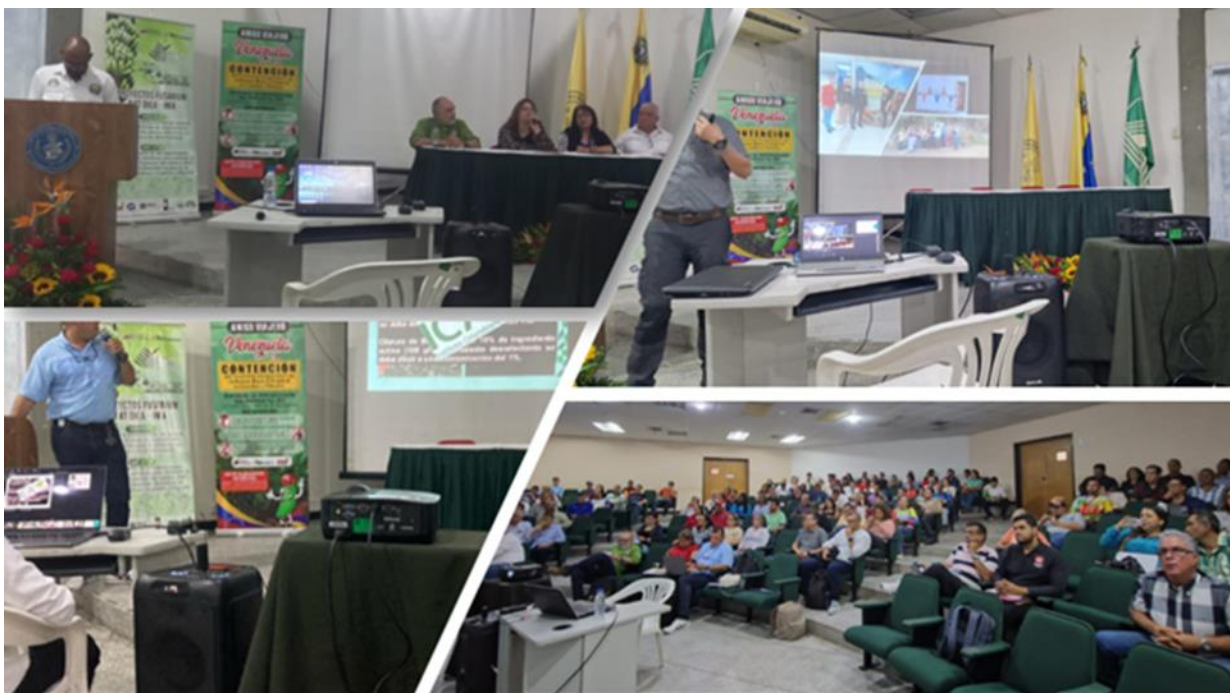
Taller de Capacitación a actores de la cadena de musáceas en la Facultad de Agronomía -UCV. Maracay con 250 participantes.

Mission to support the action plan against FocR4T, execution of training sessions in surveillance and monitoring for technicians and producers and technical assistance in biosafety, Geographic Information System (GIS) and risk analysis. January . 2024