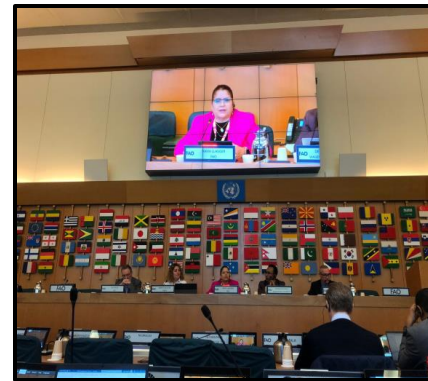
Discussion panel: Advanced technologies for the diagnosis, monitoring and surveillance of TR4. Bioversity International-CIAT/OIRSA/FAO- SLM/Wageningen University Fourth Global Conference of the World Banana Forum March 2024