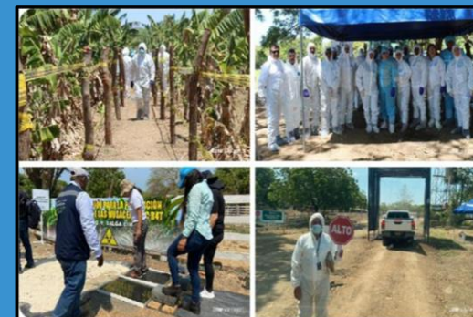
NICARAGUA SIMULACRO REGIONAL, 2023