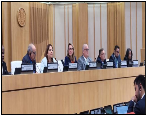
SESSION OF CPM-18 ON THE FUSARIUM TR4 PROGRAM / IPPC / APRIL 2024