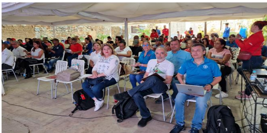
Workshop in La Guaira. 83 participation.