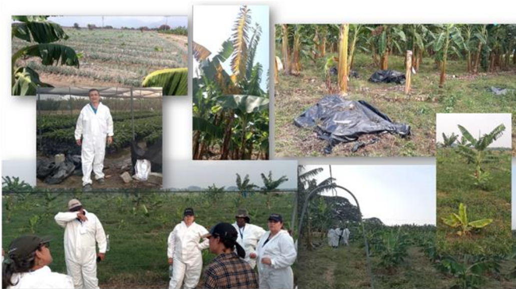
Visitas de campo con expertos internacionales y personal de la unidad de producción, técnicos de INSAI, UCV y el INIA

Mission to support the action plan against FocR4T, execution of training sessions in surveillance and monitoring for technicians and producers and technical assistance in biosafety, Geographic Information System (GIS) and risk analysis. January . 2024