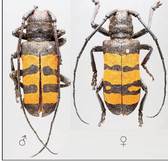
Figure 1. Adults of D. trifasciata (USDA)