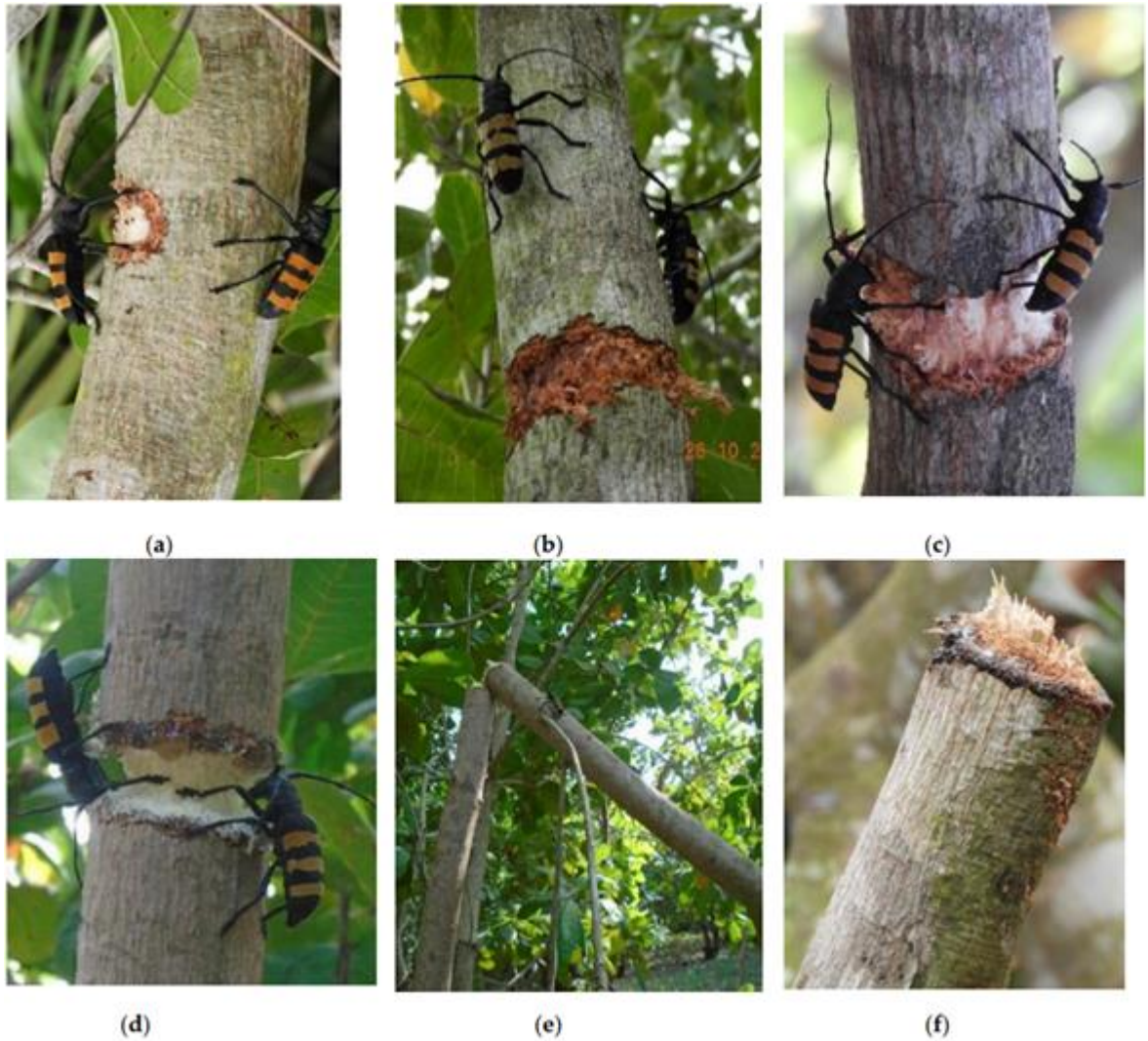
الشكل 4. تسلسل الأضرار التي لحقت بأشجار الكاجو من قبل D. trifasciata (صور من Ouali-N'Goran et al., 2020).