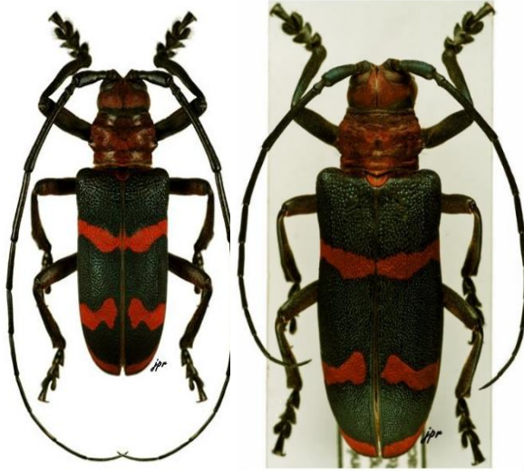
الشكل 6. أنثى (30 ملم) على اليسار، وذكر (25 ملم) على اليمين، من C. aestuans من السنغال

وصفت الصفات المورفولوجية في 2002 من قبل N'Goran et al. ويمكن العثور على صور إضافية للخنافس المماثلة في موقع Cerambycoidea.com . لا يوجد مفتاح خاص بقبيلة Ceroplesini ، التي ينتمي إليها D. trifasciata ، ولكن يوجد مفتاح على الإنترنت لقبيلة Lamiinae يمكن أن يكون مفيداً في Lamiines of the World