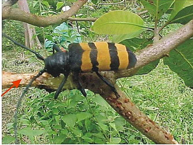
الشكل 3. يظهر البالغة D. trifasciata وهي تتغذى وتزيل من اللحاء من فرع الشجرة العائلة

خلال موسم الأمطار، ابحث عن تحزم الأغصان في الأشجار العائلة، توجد الخنافس على الأغصان القريبة من المنطقة التي تحوي اعراض تحزم. قد تظهر على الافروع المتحزمة علامات اعراض تحول الأوراق إلى اللون الأصفر، وقد تسقط بعض الفروع على الأرض. قد ترى أيضاً علامات تغذية البالغات، حيث يتم كشط اللحاء من الفروع الصغيرة للشجرة (الشكل 3 )