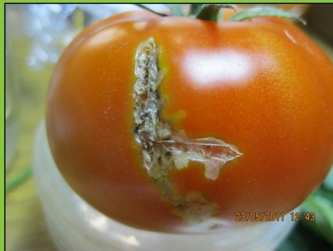
Стволы, листья и плоды томатов, поврежденные томатной молью