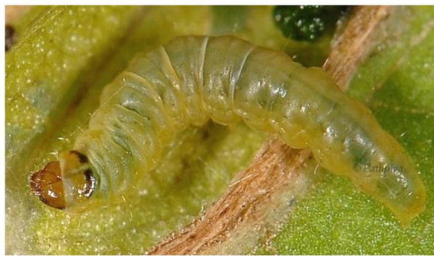
Гусеница 8-9 мм