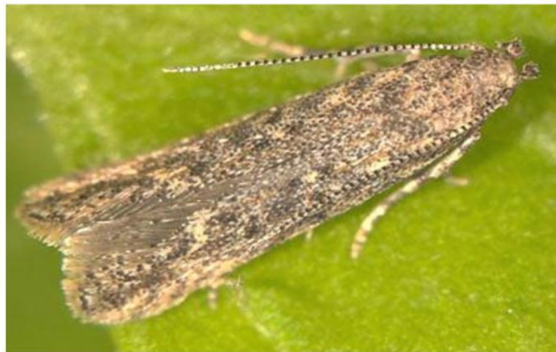
Бабочка 5-7 мм